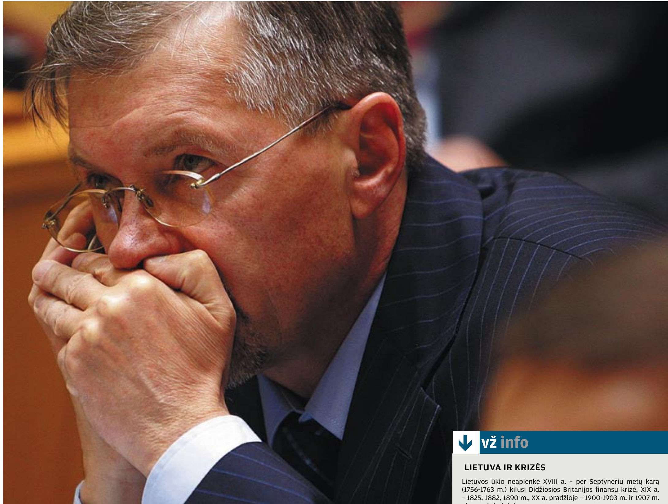
NEISIJAUDINTI Premjeras Gediminas Kirkilas: „Mes, lietuviai, labai mėgstame hipertrofuotai kalbėti, hiperboles vartoti.“

Vis dėlto artima premjero bendražygė Birutė Vesaitė, grįžusi iš Krynicos ekonomikos forumo, išpėjo Lietuvos verslininkus apie gresiančią 2009 m. ekonomikos krizę, Ponia Vesaitė ją „nukėlė“ po rinkimus. Tad ir globalios grėsmės akivaizdoje politikai manipuliuoja valstybės gerove valdžios vardan.